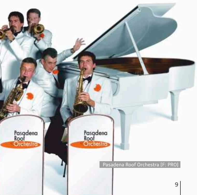
Pasadena Roof Orchestra [F: PRO]

* Mitglieder des Birdland Jazz Club Neuburg, Schüler, Auszubildende, Studenten, Schwerbehinderte und deren Begleitpersonen