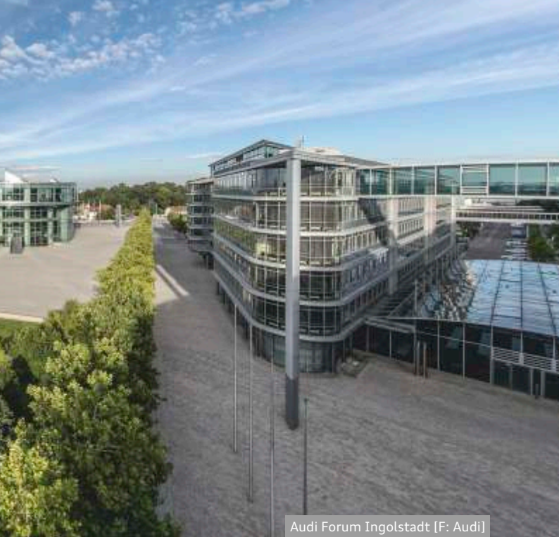
Audi Forum Ingolstadt

Ellington, will die durchaus prominent besetzte Formation nahezu alle schillernden Facetten des Jazz beleuchten. Absolute Weltklasse steht in den darauffolgenden Monaten auf dem Plan. Im Oktober kommt mit den Yellowjackets, dem Saxofonisten Bob Mintzer sowie der Sängerin Luciana Souza eines der besten Ensembles des Fusion-Jazz, während im November das legendäre Pasadena Roof Orchestra zum mittlerweile vierten Mal seine swingend-klingende Visitenkarte im Audi Forum Ingolstadt abgibt. Mehr als nur ein Geheimtipp ist mittlerweile auch die Django Reinhardt Night zum Jahresabschluss im Dezember, bei der Hochkaräter aus dem Bereich des Gypsy-Swing auf ihre individuelle Weise ihrem großen Vorbild Django Reinhardt huldigen. Diesmal wollen der Akkordeonist Ludovic Beier und das Gismo Graf Trio sowie der Violinist Tcha Limberger einige bislang eher weniger beachtete Aspekte dieser ungemein populären Musikrichtung in den Vordergrund rücken. Dabei hoffen sie einmal mehr darauf, möglichst viele Füße zum Mitwippen zu animieren.