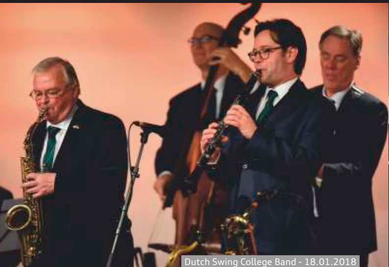
Dutch Swing College Band - 18.01.2018